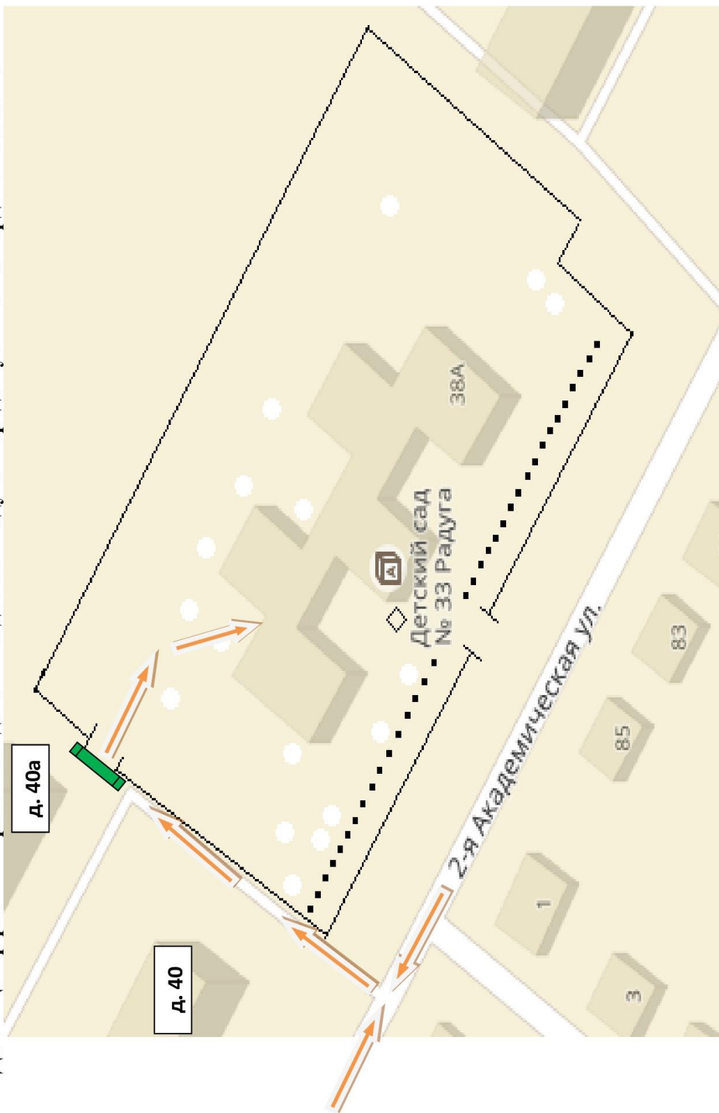
Схема движения технологических транспортных средств к месту разгрузки по территории МАДОУ «Центр развития ребёнка – детский сад № 33 «Радуга» города Губкина Белгородской области.